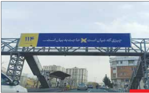
بنرهای خلاق! / به تازگی سازمان اطلاعات سپاه در سطح شهر تهران بنرهای خلاقانه‌ای را منتشر کرده است که مردم را برای اطلاع‌رسانی درباره عملیات‌های ضدایرانی دشمن مشتاق‌تر می‌کند.