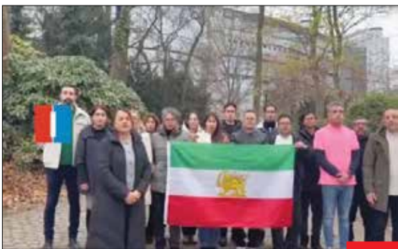
تجمع بی‌وطنان/ «ایرانیان بلژیک» ، ایترنشال و تمام بی‌وطنانی که برای حادثه استرالیا و کشته شدن ۱۲ نفر غمگین هستند، در جنگ ۱۲ روزه، ریخته شدن خون هموطنانتان به دست دشمن اذیتتان نکرد؟!