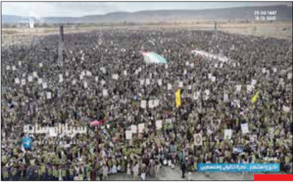
همچنان پای‌کار/ در این روزها که رژیم صهیونیستی به دور از نگاه خبرنگاران و رسانه‌های دنیا اقدام به ترور فرماندهان و مردم مظلوم فلسطین می‌کند مردم یمن همچنان پای کار فلسطین هستند.