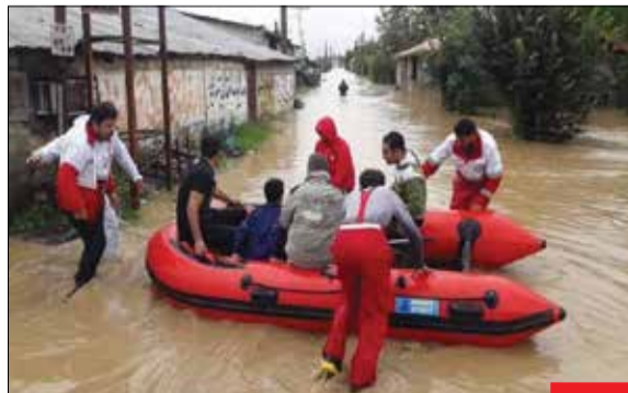
سیل مهربانی/ در این روزهای بارانی نیروهای بسیجی و هلال‌احمر کشورمان بی‌وقفه در حال خدمت‌رسانی به سیل‌دیدگان هستند؛ به گونه‌ای که در هرمرگان بیش از ۶۰۰ گروه جهادی بسیج به کمک مردم رفتند.