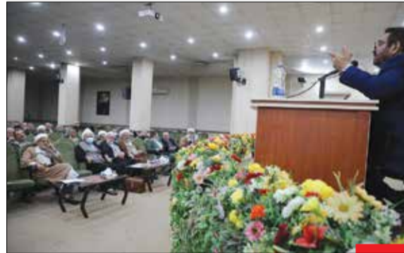
ارتقای توانمندی هادیان پیشکسوت/ به همت معاونت سیاسی سازمان پیشکسوتان سپاه کارگاه‌های تخصصی برای هادیان سیاسی بازنشسته سپاه برگزار شد.