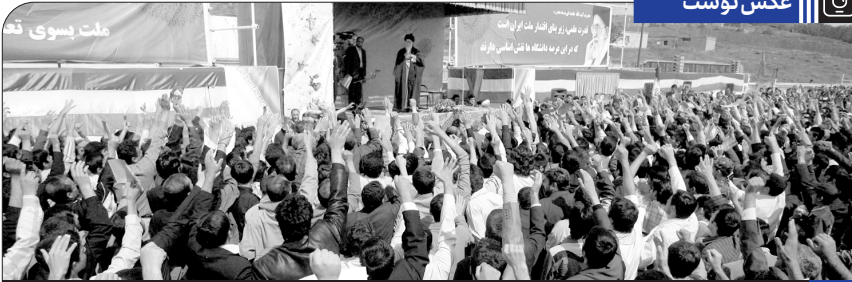
دیدار دانشجویان کردستان با رهبر انقلاب در تاریخ ۱۳۸۸/۲/۲۷