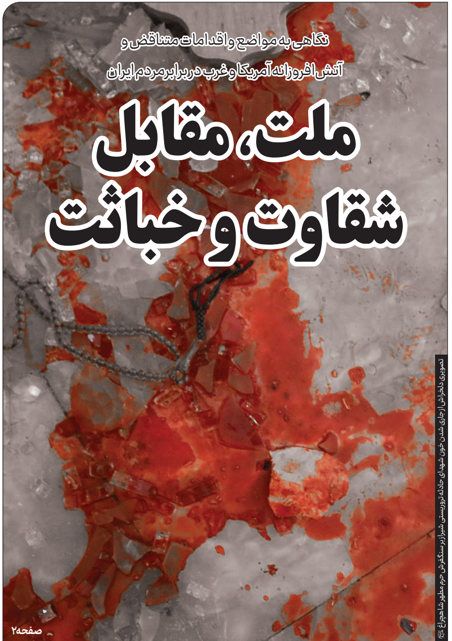
تصویری داخل آرش خدای شهدای حادثه تروریستی شهید آرزو سگدوش حرم مطهر شاهچراغ (ع)

نگاهی به مواضع و اقدامات متعاقب و آتش افروخته آمریکا و غرب در برابر مردم ایران