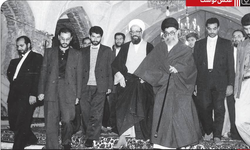
حضور حضرت آیت الله خامنه ای در مرقد مطهر حضرت عبدالعظیم حسنی (ع) ● ۱۳۷۳/۸/۵