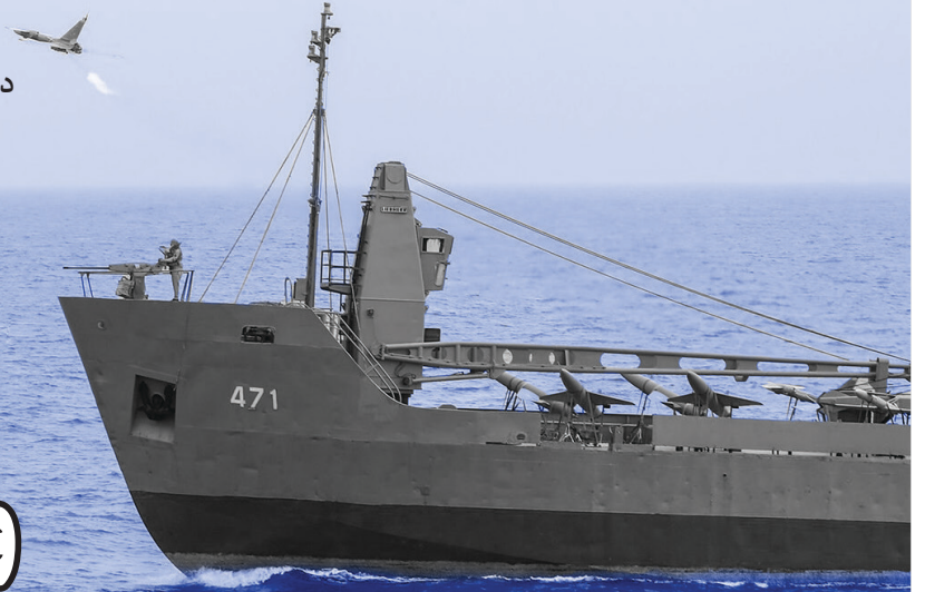
تصویر: رونمایی از اولین ناو دسته پهپاد بر نیروی دریایی راهبردی ارتش؛ ۲۴ تیرماه ۱۴۰۱

نظامی، ضرورتی انکارناپذیر است: «یک روز در این کشور، اگر قطعه‌ای از جنگنده‌هایی که امروز شما دارید، خراب می‌شود، آن را داخل هواپیمای گذاشتند و برای تعمیر به آمریکا می‌برند و برمی‌گردانند؛ یعنی اجازه نمی‌دهند این قطعه در ایران باز شود و مهندس و صنعتگر نظامی ایرانی، اصلاً بدانند درون این قطعه چیست... اوایل جنگ و فتی می‌گفتند فلان قطعه را نداریم، ما عزامی گرفتیم و می‌ماندیم آن را از کجا بیوریم.» • ۱۳۸۲/۱۱/۱۹