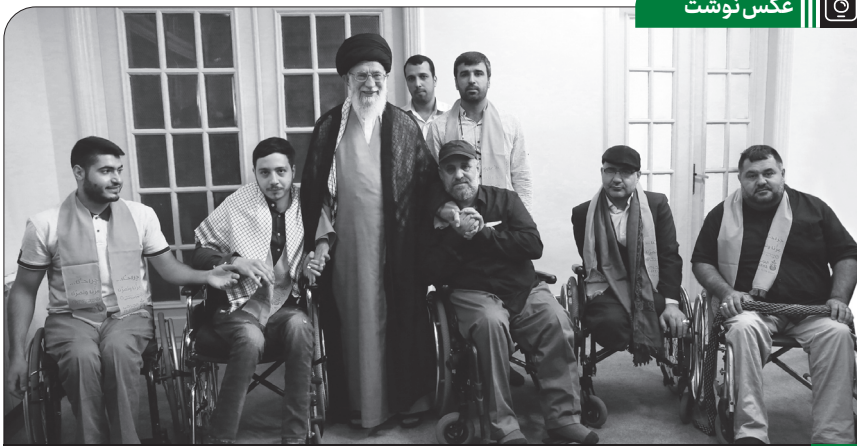
دیدار جانبازان حزب الله لبنان با رهبر انقلاب اسلامی در تاریخ ۱۳۹۷/۴/۲۲