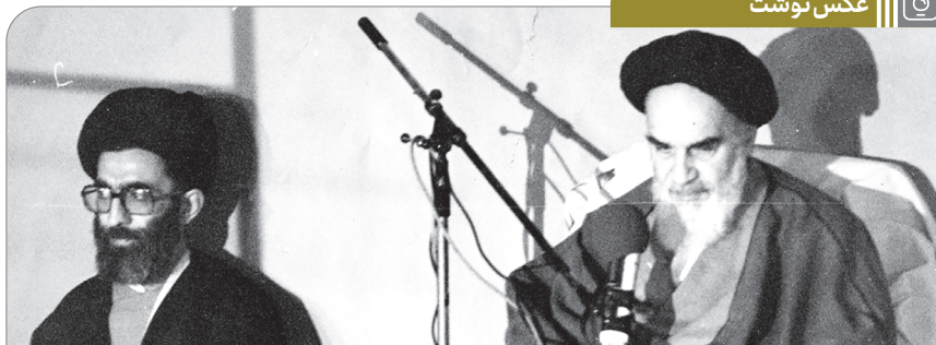
تصویری از آیت‌الله خامنه‌ای در کنار حضرت امام خمینی (۱۳۶۰/۷/۱۷)