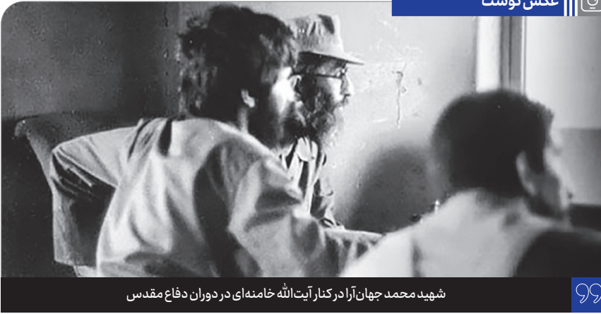
شهید محمد جهان آرا در کنار آیت الله خامنه ای در دوران دفاع مقدس