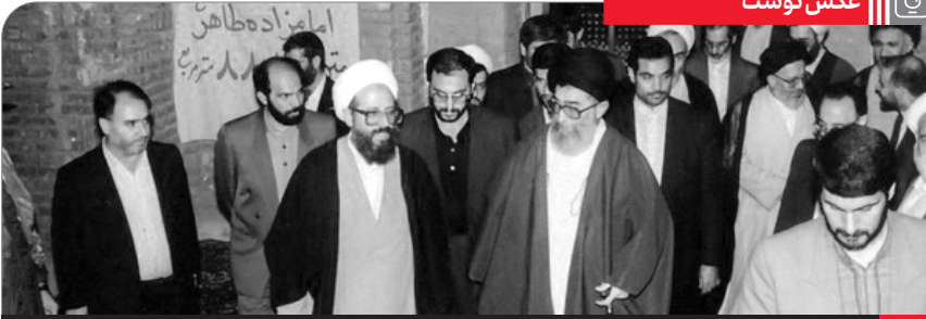
حجت الاسلام والمسلمین ری شهری در کنار رهبر انقلاب در جریان حضور در حرم مطهر حضرت عبدالعظیم حسنی

یک نکته ی دیگر در باب نوروز، ذوق و سلیقه ی ویژه ی ایرانی است که در آن، انسان احساس ژرف اندیشی میکند؛ بهار را آغاز سال خود قرار دادن. بهار مظهر امید است، پیام آور امید است؛ بهار به انسان میگوید که خزان و برگریزان حتماً رفتنی است و طراوت و نوسازی و نوگرایی حتماً آمدنی است؛ این، خصوصیت بهار است. یک چنین پیامی را به مردم میدهد: پیام طراوت، پیام رویش. البته این امید، امسال مضاعف هم بود، به خاطر همراهی با نیمه ی شعبان که روز نیمه ی شعبان هم روز تولد امید بزرگ تاریخ و امید بزرگ بشریت است؛ و امید، منشأ همه ی حرکتها و پیشرفتها است. ● ۱۴۰۱/۰۱/۱۴