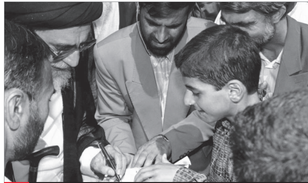
سفر یک روزه رهبر انقلاب به آمل ۷۷/۳/۲۱

به برکت ماه رمضان، برای مسلمان فرصتی پیش می‌آید که باید از آن در جهت تقویت حیات معنوی و نشاط مادی خود استفاده کند. یکی از درسهای بزرگ ماه رمضان که در خلال دعا و روزه و تلاوت قرآن در این ماه باید آن را فرا بگیریم و استفاده کنیم، این است که با چشیدن گرسنگی و تشنگی، به فکر گرسنگان و محرومان و فقرا بیفتیم. در دعای روزهای ماه رمضان می‌گوییم: «اللهم اغن کل فقیر، اللهم اشبع کل جائع، اللهم اكس كل عريان» (۱). این دعا فقط برای خواندن نیست؛ برای این است که همه خود را برای مبارزه با فقر و مجاهدت در راه ستردن غبار محرومیت از چهره‌ی محرومان و مستضعفان موظف بدانند. این مبارزه، یک وظیفه‌ی همگانی است. در آیات قرآن می‌خوانیم: «أرأیت الذی یکذب بالذین. فذلک الذی یدعّ البیتیم. و لایحض علی طعام المسکین» (۲). یکی از نشانه‌های تکذیب دین این است که انسان در مقابل فقر فقیران و محرومان بی‌تفاوت باشد و احساس مسؤولیت نکند. ● ۱۱/۹/۱۵ (۱) بحار الأنوار، ج ۹۵، ص ۱۲۰. (۲) ماعون، ۱-۳.